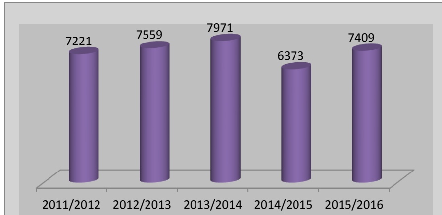
شكل (3): عدد المعلمات في الرياض خلال الفترة (2016/2015 - 2012/2011)

3. بلغ عدد المعلمات في مدارس الرياض الحكومية والاهلية (7409) معلمة في العام الدراسي 2016/2015 وتشكل نسبتهن في مدارس الرياض الحكومية (74.4%) مقابل (25.6%) في مدارس الرياض الاهلية وبالمقارنة مع العام الدراسي الماضي نجد ان هناك زيادة حصلت في عدد المعلمات بنسبة (16.3%) . كما شهدت الفترة (2016/2015-2012/2011) زيادة بنسبة قدرها (2.6%) حيث كان عدد المعلمات (7221) في العام الدراسي 2012/2011 .